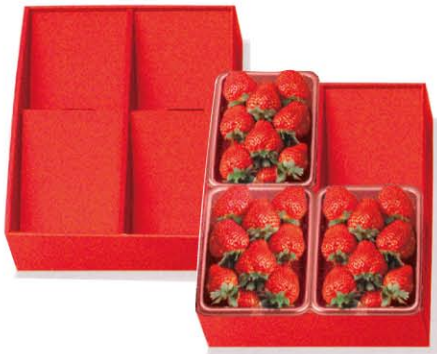
いちご4P陳列ケース (赤) サイズ：260×350×45 材質：ダンボール 入数：100/ケース (10/小袋)