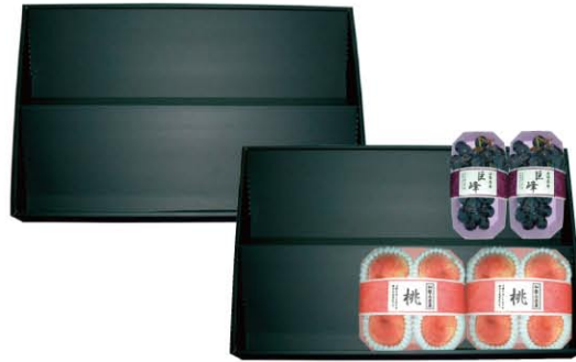
トレー用陳列ケース (黒) サイズ：600×400×60 材質：ダンボール 入数：30/ケース (3/小袋)