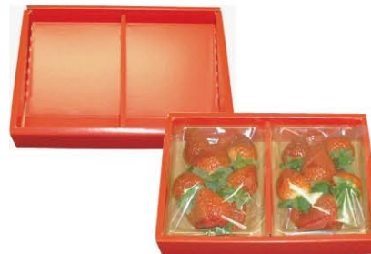
いちご2P陳列ケース (赤) サイズ：260×185×45 材質：ダンボール 入数：100/ケース (10/小袋)