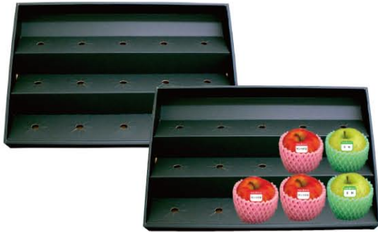
1P用陳列ケース (黒) サイズ：600×400×60 材質：ダンボール 入数：20/ケース (2/小袋)