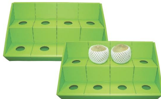
メロン陳列ケース サイズ：600×380×90 材質：ダンボール 入数：8/ケース