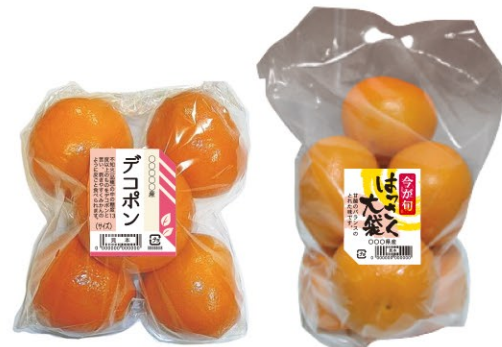
(中) サイズ: タテ 65 × ヨコ 52 mm (小) サイズ: タテ 57 × ヨコ 42 mm